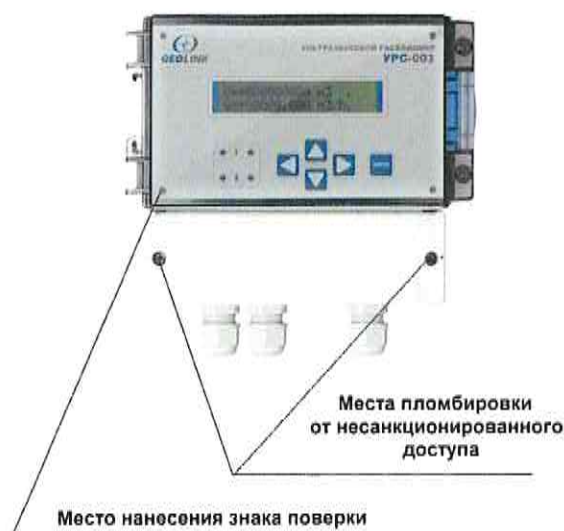
Рисунок 2 – Схема пломбировки от несанкционированного доступа и обозначение места нанесения знака поверки