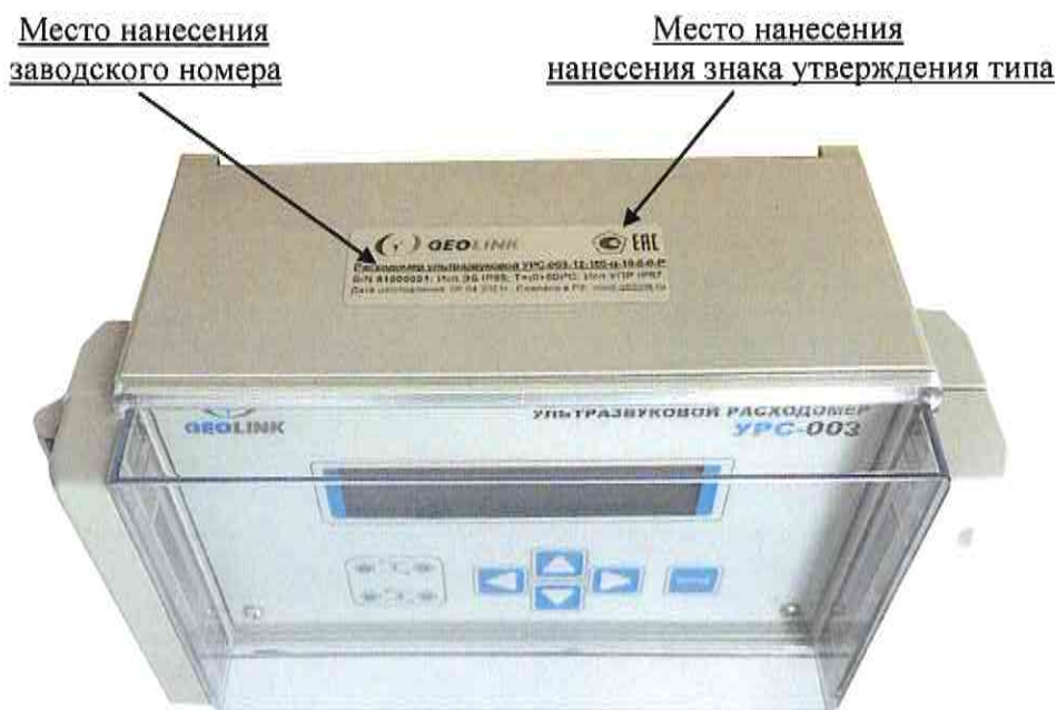
Рисунок 3 – Места нанесения заводского номера и знака утверждения типа