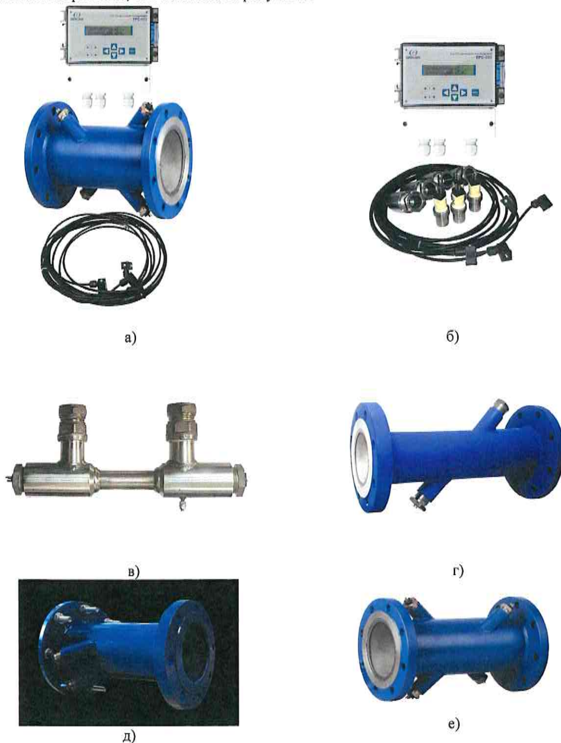
Рисунок 1 – Общий вид расходомеров ультразвуковых УРС-003: а – исполнение расходомера с установленными в участок трубопровода ПЭП на заводе-изготовителе; б – исполнение расходомера, представляющее собой комплект ПЭП и их держателей для установки непосредственно в трубопровод; в – исполнение УПР с U-образным ИУ; г – исполнение УПР с прямым ИУ по однолучевой схеме с диаметральной расположением акустического канала; д – исполнение УПР с прямым ИУ по двухлучевой схеме с расположением акустических каналов на параллельных хордах е) – исполнение УПР с прямым ИУ по двухлучевой схеме с расположением акустических каналов на перекрещенных хордах

Заводской номер расходомера указывается на маркировочной наклейке, закрепляемой на боковой стороне ЭБ, как показано на рисунке 3.